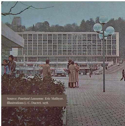
Source: Pourtant Lausanne, Eric Mathyer. Illustrations J.-C. Ducret, 1978.